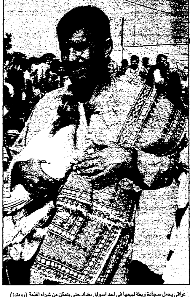
عراقي يحمل سجادة ولبيا في أحد أسواق بغداد حتى يتمكن من شراء اغذية

طرابلس - ف: أكدت وكالة الجماهيرية الليبية الرسمية لثلاثاء السيدات ان أي خبير عراقي في الاسلحة الاستراتيجية موجود في ليبيا، وذلك نفيًا لخبر أورثته صحيفة بريطانية ومفادته ان طرابلس تلقى مساعدات من علماء وخبراء عراقيين لتكوين برنامج سري لإنتاج اسلحة من هذا النوع. وأكدت صحيفة الجارديان البريطانية في عددها الصادر في 6 كانون الثاني (يناير) عن تقارير استخباراتية غربية لتكوين الاسلحة الاستراتيجية في ليبيا على برنامج سري في طرابلس وبغداد قبل سبعة اشهر.